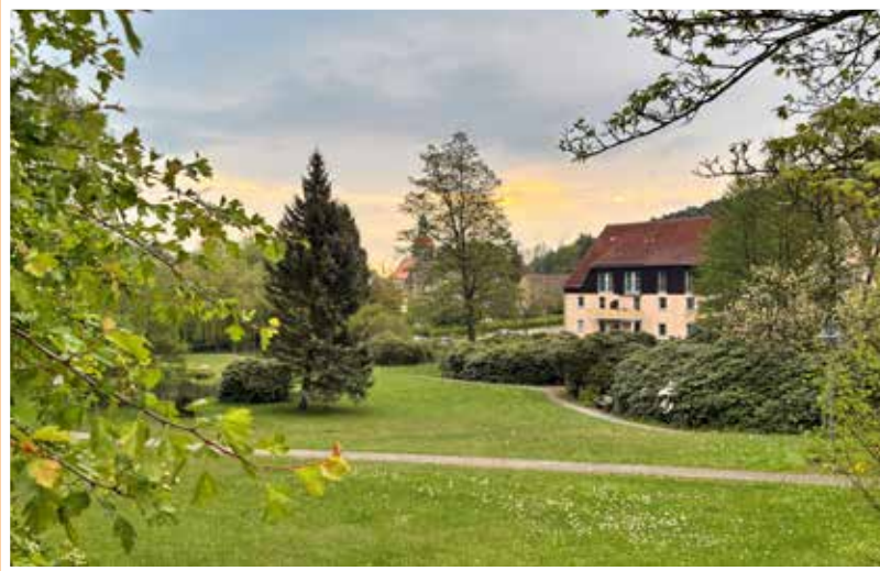
morgendlicher Blick durch den Kurpark auf die Kirche