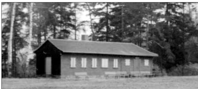
Das Bild zeigt das 1974 errichtete Holzgebäude auf dem Sportplatz. Auch dieses ist inzwischen verschwunden.