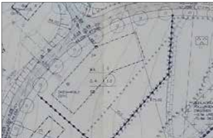
Baufeld gemäß B-Plan