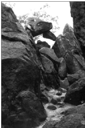
Am Eingang zum Bärloch befindet sich die durch einen Felssturz entstandene „Mausefalle“, wo ein kleiner einen großen Felsblock stützt.