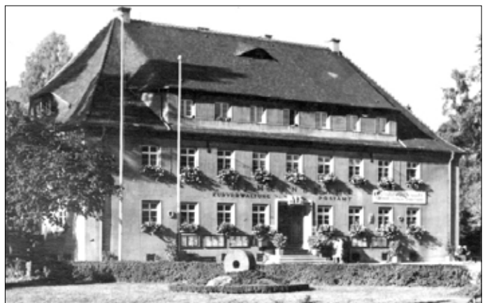
Das letzte Postamt um das Jahr 1955.

Für den Postagenden Paul, mit seinen 6 Kindern wurde es in der Zittauer Straße zu eng und er ließ auf der Heide 1900 das Landhaus zur Post errichten, in dem sich diese bis 1927 befand, bevor das neu erbaute Post- und Gemeindeamt 1928 eröffnet wurde. Es bleibt zu wünschen, daß sich in Zukunft nichts mehr verändert, da Postagenturen geschlossen werden.