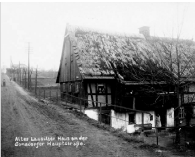
Altes Lausitzer Haus an der Jonsdorfer Hauptstraße; links oben neben der Straße steht bereits das 1900 neu erbaute Posthaus auf der Heide.

Die Zittauer Nachrichten, die mit der Nachmittagspost eingingen, wurden fast in jedem Haus gelesen. Dazu kam die Flut an Post, die die immer zahlreicheren Sommerfrischler mit sich brachten. Bald konnte ein Postbote allein den Ansturm nicht mehr bewältigen und es mußte noch ein Zeitungsjunge und ein zweiter Bote eingestellt werden. Im Ort gab es nur sehr wenige Telefone und die Tochter des Boten mußte z. Bsp., wenn eine Depesche für den Nonnenfelsen kam, diese persönlich da hinauf bringen.