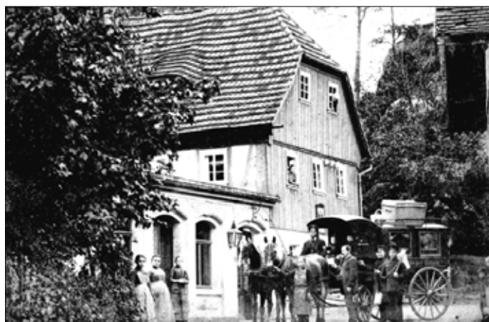
Die letzte Postkutsche mit Pferden in Oybin.