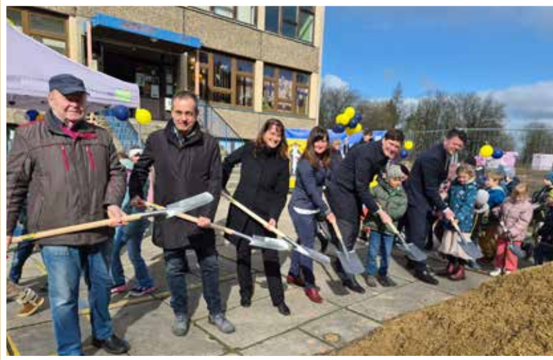
Spatenstich am 01.04.26 für den Ersatzneubau der Naturparkgrundschule Zittauer Gebirge